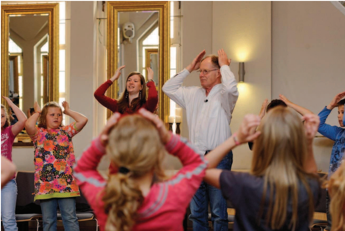
Auch der eigene Körper kann bei Rhythmus- und Koordinationsübungen zum Instrument werden.