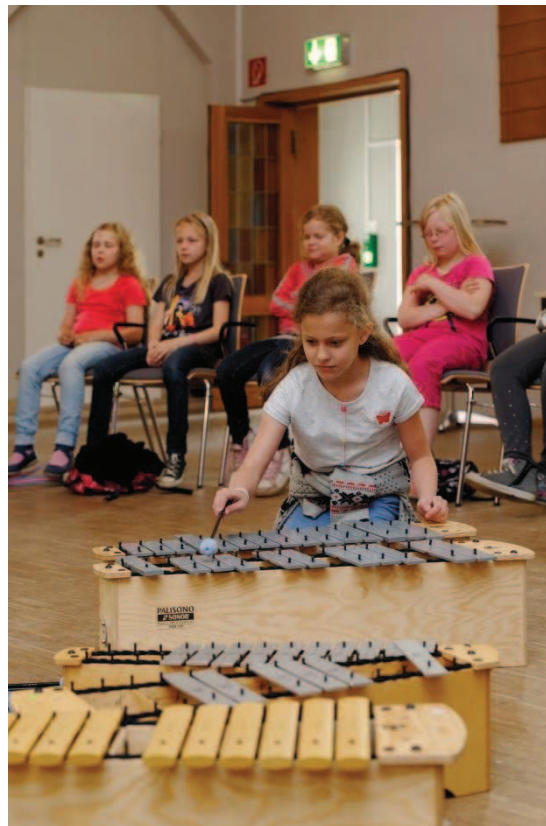
Wie klingt Nebel? Musikalische Experimente der Klasse 3b der Grundschule an der Bochumer Straße Recklinghausen.