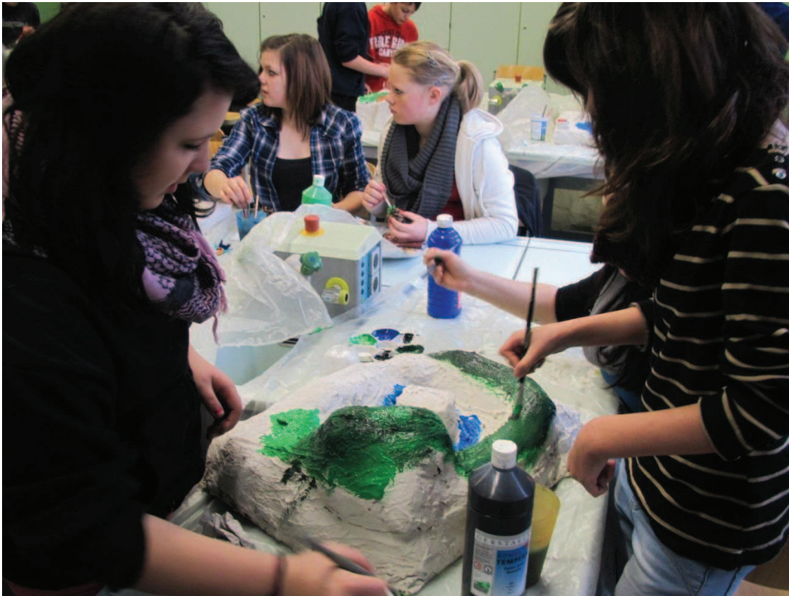
Mit dem neu Erlernen setzten sich die EmscherKids künstlerisch auseinander.