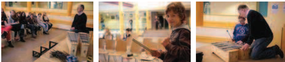
Eindrücke aus dem Musikworkshop im Forum der JKG

Die „kleine Schwatte aus Ickern“ inspirierte schon vor Jahren den Castroper Künstler Rudolf Grabowski zur Komposition des gleichnamigen Liedes. Nun nähern sich auch die „EmscherKids“ (ein Schulprojekt der EmscherGenossenschaft) von der Janusz-Korczak-Gesamtschule (JKG) auf musikalischem Weg dem Fluss, dem unsere Region ihren Namen verdankt.