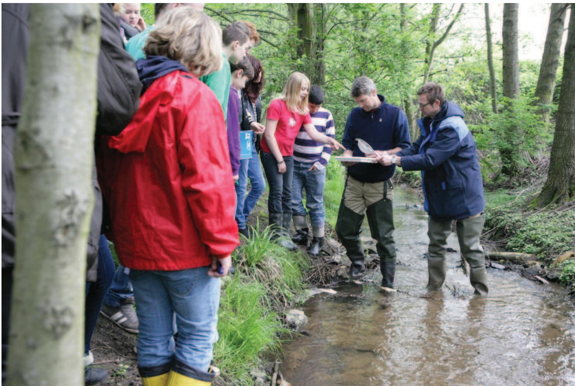
Die EmscherKids entdecken in vielen Workshops das Themengebiet Wasser und erhalten naturwissenschaftliche und geographische Informationen über die Emscher und das Emschertal.