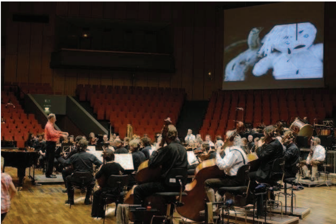
Ein besonderer Höhepunkt des Konzerts war die Präsentation eines Films der EmscherKids, zu dem die Bochumer Symphoniker den zweiten Satz aus Charles Ives Three Places in New England – The Housatonic at Strockbridge spielten.