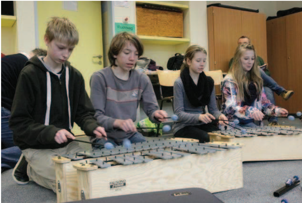
In einem Workshop lernen die EmscherKids der Gesamtschule Essen-Holsterhausen die Musik von Charles Ives kennen.