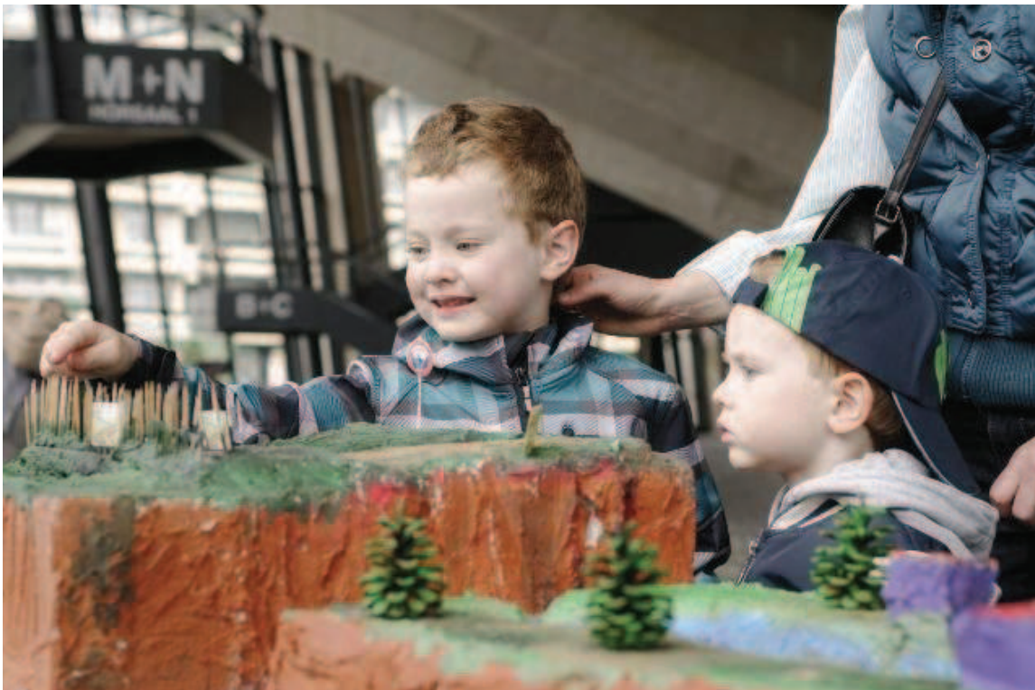
Anfassen erlaubt: Die Ergebnisse der EmscherKids werden vor dem Familienkonzert im Foyer des Audimax der Ruhr-Universität Bochum ausgestellt und von allen Altersschichten des Publikums neugierig begutachtet.