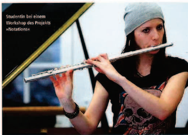
Studentin bei einem Workshop des Projekts »Notations«

»Education«-Programm fördert Schüler und Hochbegabte